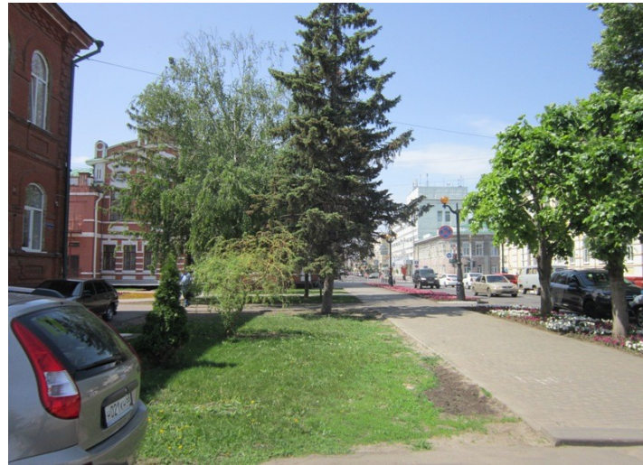
Подход со стороны ул. Советской(запасной вход)