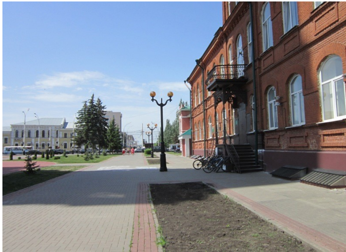
Подход со стороны ул. Советской(главный вход)